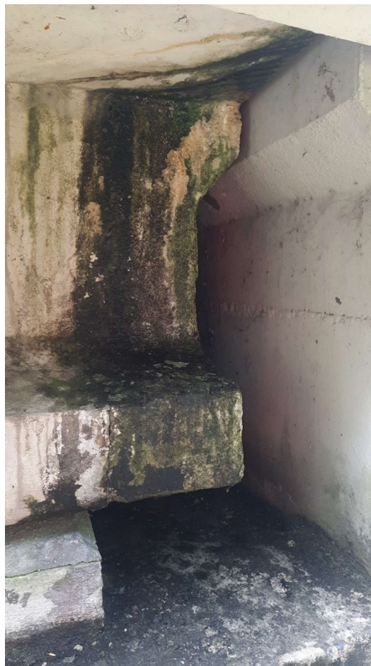
Obrázek 5 – Výluhy a nečistoty