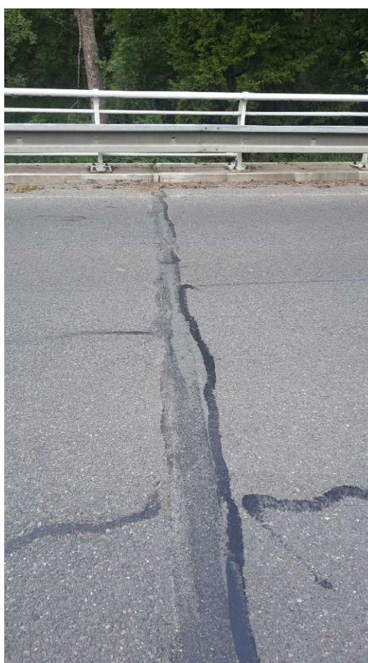
Obrázek 3 - EMZ OP1