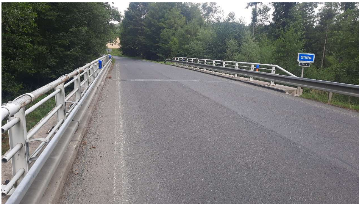
Obrázek 1 - Pohled směr Nemilkov