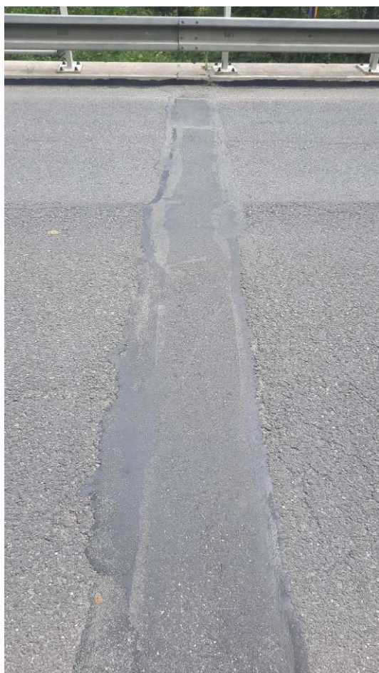
Obrázek 2 - EMZ OP2